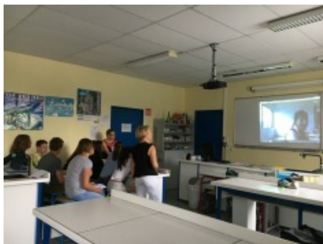
Première découverte visuelle fin juin

Nous mettrons en place à la rentrée les modalités pour faire vivre cette relation entre deux mondes.